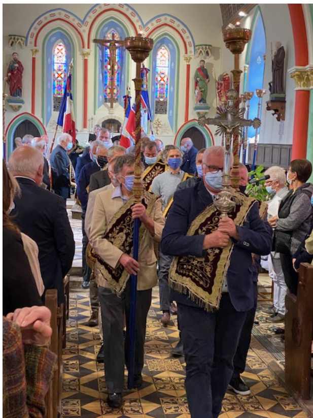
La Charité de Saint-Pierre était présente